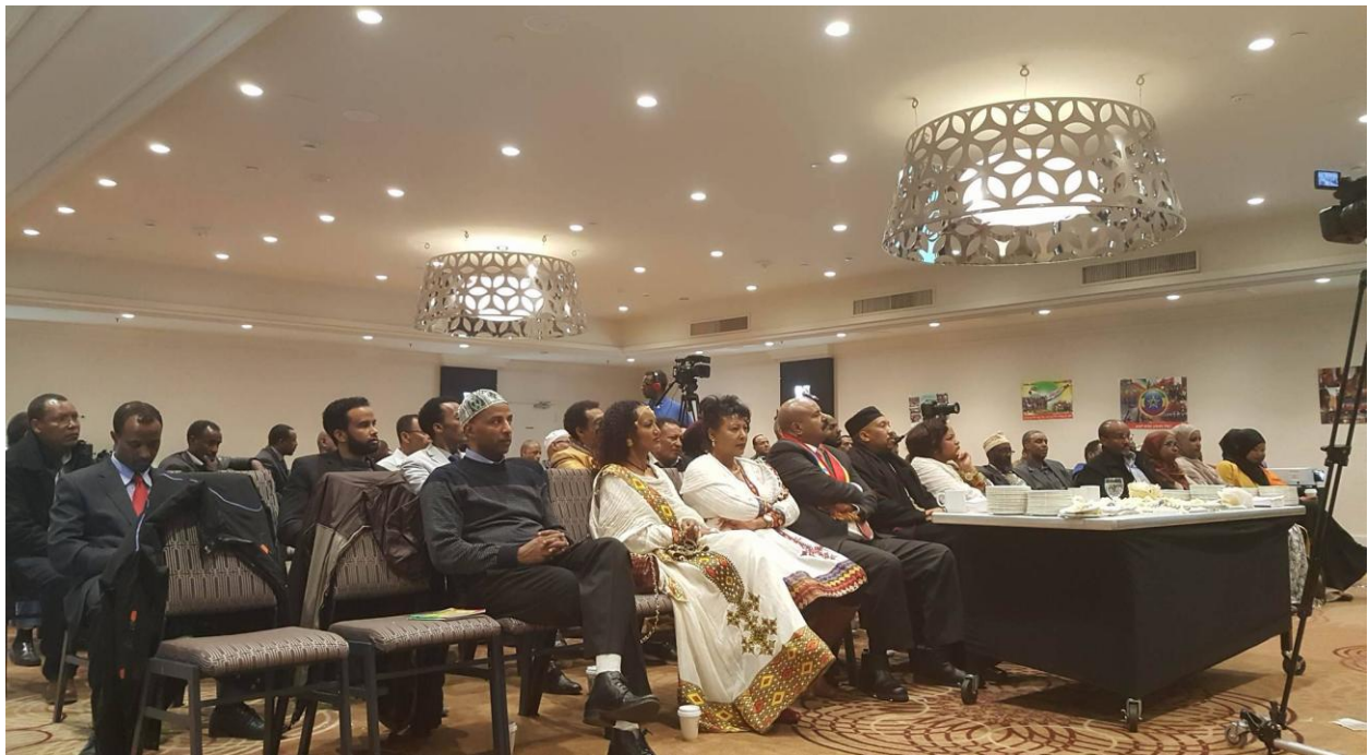
በቶሮንቶ የተገኙ የበዓሉ ታዳሚዎች በከፊል፤