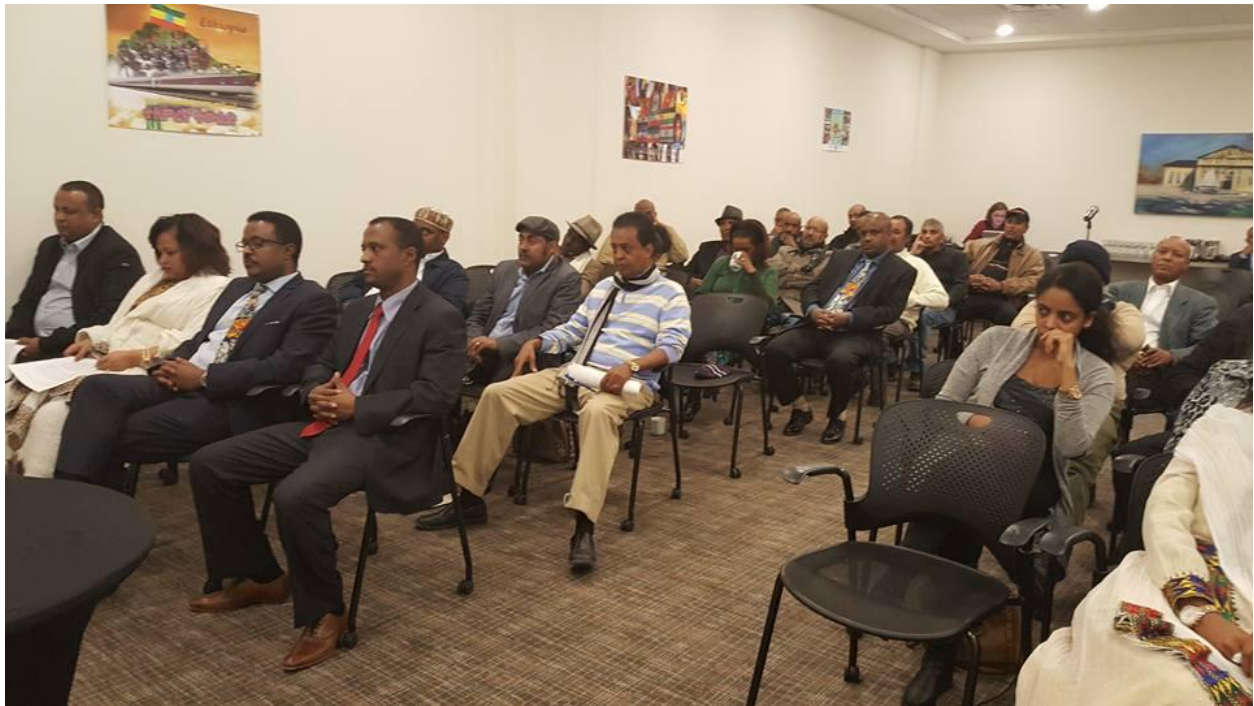
በአታዋ የተገኙ የበዓሉ ታዳሚዎች በከፊል፤